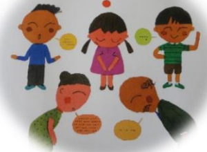
挨拶絵本 五味太郎