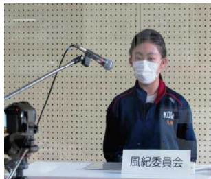
前日リハーサルの様子

生徒会の各委員長が活動目標や日常の活動内容などについて説明しました。カメラに向かって話すことには慣れていない様子でしたが、各委員長や各キャプテンともに、1年生に分かりやすく説明しようと前日のリハーサルから誠実に取り組んでいました。