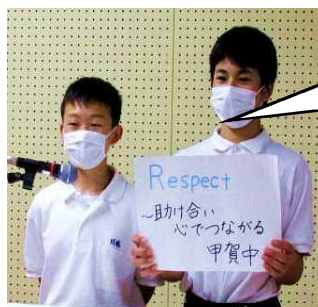
TV放送でスローガン発表

このスローガンには、「相手を尊重し、みんなが心でつながる」、そして「手を取り合って互いに助け合おう」という想いが込められています。新型コロナウイルスのことで大変な今だからこそ、手を取り合い、助け合える仲間でありたいと思います。そして、みんなで一致団結してこの困難を乗り越え、また新たな甲賀中の歴史を築き上げましょう。