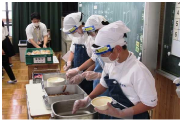
楽しみにしていた給食も再開

今回の臨時休業の経験を活かし、これまで「あたり前だと思っていたこと」に対して今まで以上に感謝しつつ、「時間の大切さ」「家庭での有意義な過ごし方」を意識して生活してほしいと思います。