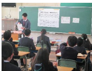
がっきゅうびら 学級開きのようす