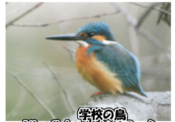
学校の鳥 Kingfisher(キングフィッシャー) 「かわせみ」