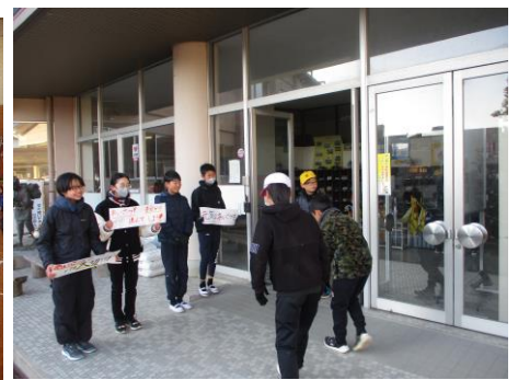
代表委員会によるあいさつ運動

1月21日(火)に中学年親子ひびき合い活動が行われました。1年間を通して低・中・高学年に分けての実施でしたが、どの学年の保護者様からも「楽しかった!」というお声を多くいただきました。学年委員の皆様には楽しい企画・運営に携わっていただき、誠にありがとうございました。