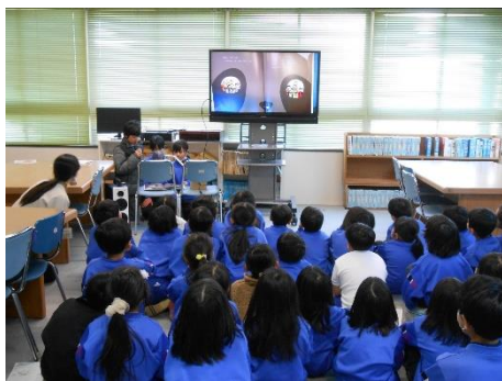
図書委員会による昼休みの読み聞かせ