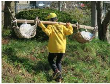
← 岩削り体験 土運び体験 ↑