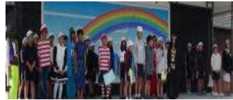
<紹介チラシ作成6年>

■午後には、色別のグループで、スタンプラリーを行い、宿場かるたや展示を見学しました。この他、仮装大会やわらじ飛ばし、アクセサリづくり、ピンゴ大会、お楽しみ抽選会など、まつりを堪能しました。