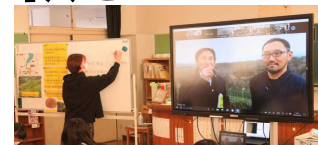
県内4小学校を結んだオンライン授業

コロナ禍の中、今急速に進みつつあるのが、学校のICT機器の整備とその活用です。文科省から「ギガスクール構想」が打ち出され、子どもたち一人一台のタブレットの配置が全国的に進んでいます。本校は数年前から、他校に先駆けて、タブレットや電子黒板の配置をいただき、授業や学習活動での有効な活用方法について研究を進めてきました。