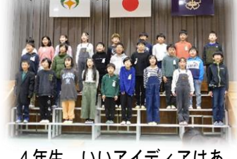
4年生 いいアイデアはありませんか

2月27日(火)の「6年生を送る会」では、どの学年も本番に向けて学習を積み上げ、見事な出来栄とともに、6年生に感謝とエールを届けました。6年生からも6年間を振り返ったオリジナルの劇の発表があり、会場は大きく盛り上がりました。