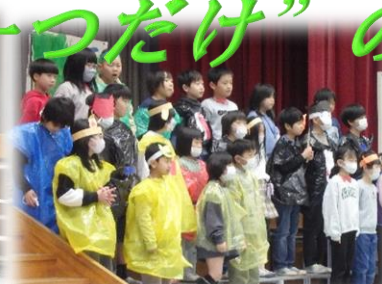
3年生 三年以内におにをたおせ!