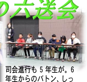
司会進行も5年生が。6年生からのバトン、しっかり受け継ぎます!