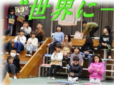
2年生 6年生の〇〇〇なトコロ