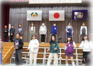
5年生 進行・ダンスなど大忙しで大活躍!