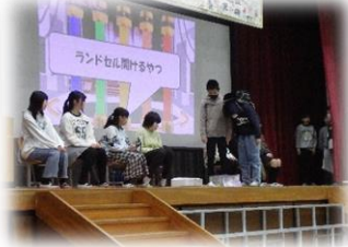
6年生 6年間の思い出～土リーグ!～