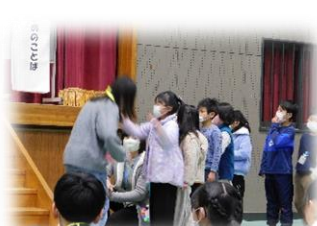
1年生がメダルをプレゼント