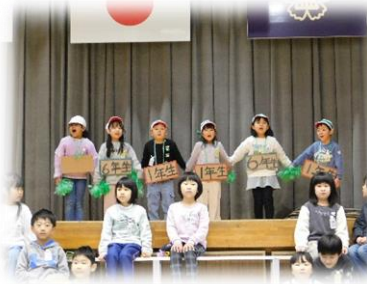
1年生 6年生といっしょにすごした一年間 思い出のはるなつあきふゆ