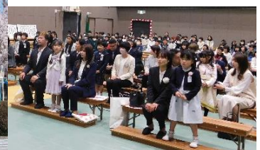
お返事もしっかり できました。