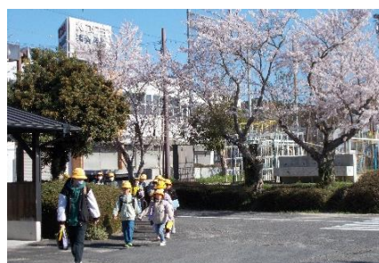
桜の花の下、元気に登校！