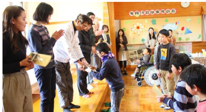
給食感謝集会で お礼のお手紙をわたしました

そのような取り組みの一環として裏面にもありますように、先月末に給食感謝集会を開きました。子どもたちは、これまで食に関わって米作りや伝統食の学習など多くのことを地域の方から教わってきました。そのことをふりかえってまとめ、教えていただいたことに改めて感謝しながら発表していました。また日々いただいている給食についても、多くの方が自分たちの健康な成長を願い、命を育むために力を尽くしてくださっていることに気づかせることができました。